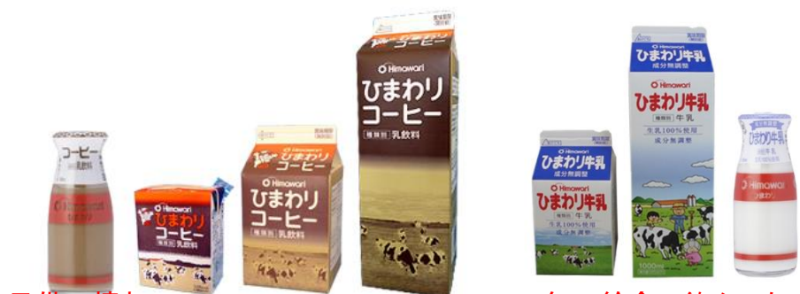
子供の憧れ ひまわりコーヒー

高知県の大人も子供も「ひまわり」で育つ 高知県乳製品メーカー「ひまわり乳業」は、 給食で牛乳で採用されており、県内では非常に浸透したメーカー