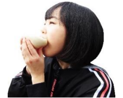
上下ひっくり返すのがあぐり流！

一般的な豚まんは上下そのままに食べても具がこぼれることはありませんが、あぐりの豚まんは具がたっぷり入っています。これをこぼさず食べるには上下をひっくり返してどんぶり状にすることをお勧めします。この食べ方があぐり流！！