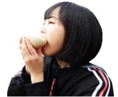
上下ひっくり返すのがあぐり流！

一般的な豚まんは上下そのままに食べても具がこぼれることはありませんが、あぐりの豚まんは具がたっぷり入っています。これをこぼさず食べるには上下をひっくり返してどんぶり状にすることをお薦めします。この食べ方があぐり流！！